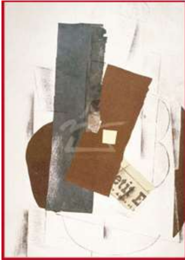
Guitares , Georges Braque, 1913

Dès le début du XXe siècle, Pablo Picasso et Georges Braque introduisent par collage des fragments de journaux dans leurs œuvres. Les artistes du mouvement Dada et les Surréalistes réalisent des collages et des photomontages en utilisant eux aussi toutes sortes d'objets imprimés.