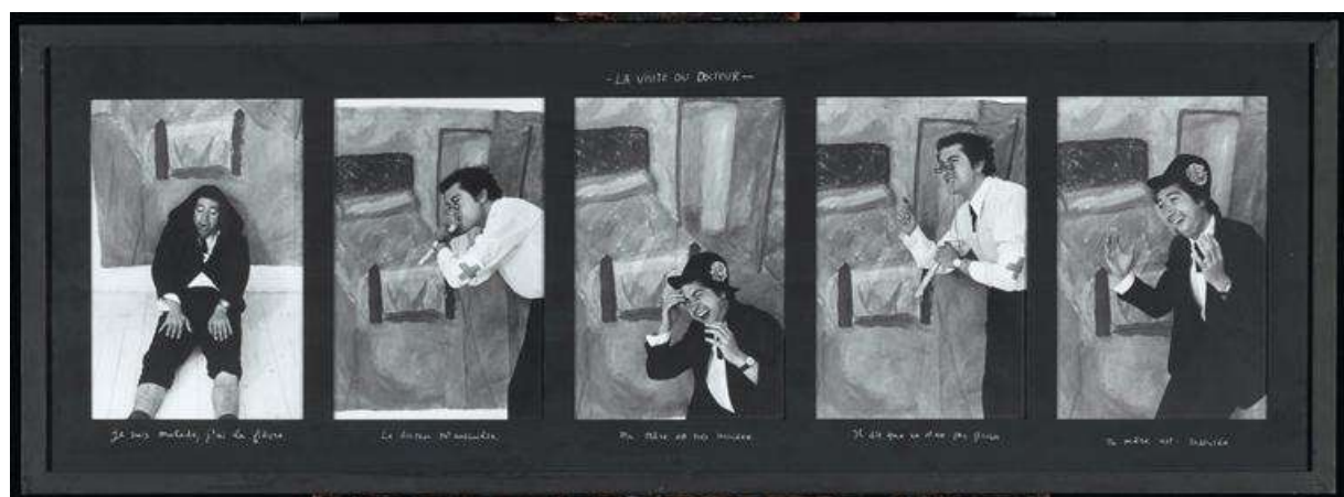
La visite du docteur, Christian Boltanski, 1974, Centre Georges Pompidou, Paris