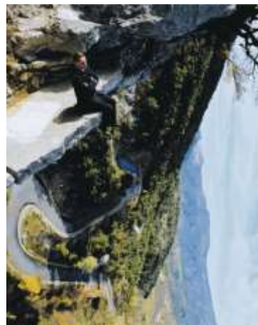
Untitled , 2015 Philippe Ramette