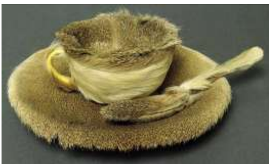
Le déjeuner en fourrure, 1936 Meret Oppenheim,