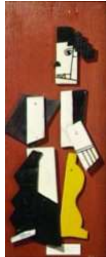
Charlot, Fernand Léger, 1924