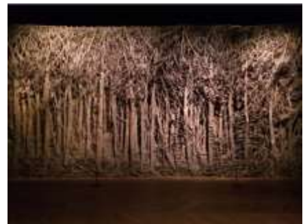
Forêt en carton , E. Jospin, 2013