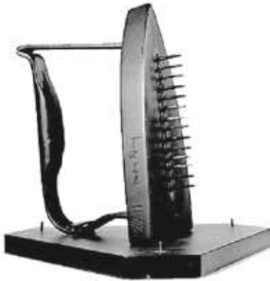
Le cadeau , Man Ray, 1921