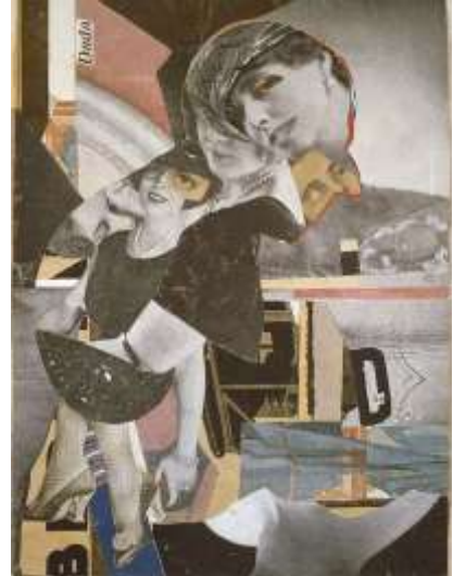
Da Dandy , Hannah Hoch, 1919