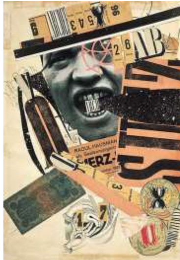
ABCD , Raoul Hausmann, 1923