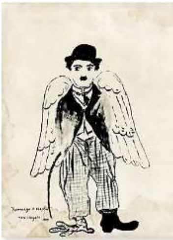
Charlie (Chaplin), Marc Chagall, 1919