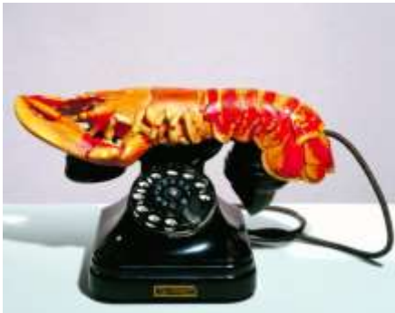
Téléphone homard ou Téléphone aphrodisiaque, 1936, Salvador Dali, Francfort