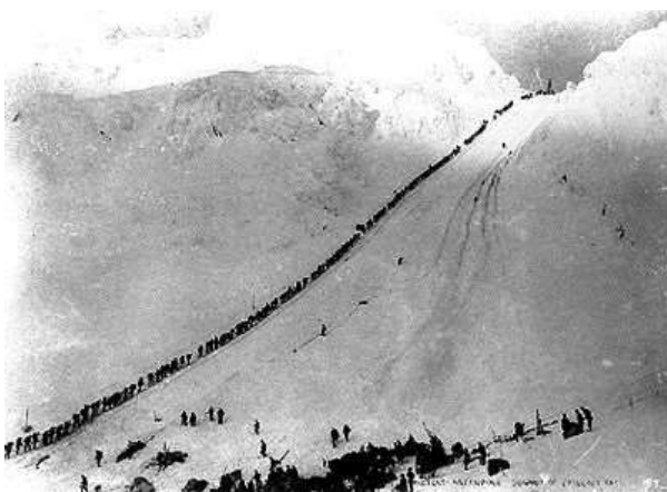
Porteurs montant vers le col de Chilkoot, 1898

Le tournage fut compliqué ; plus de 600 figurants, des décors extravagants et des effets spéciaux. Le tournage dura 16 mois.