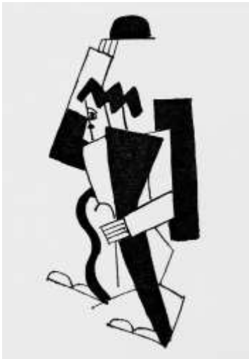
Charlot, Fernand Léger, 1920