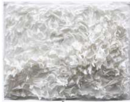
Panneau en papier , G. Pestmal, 2012