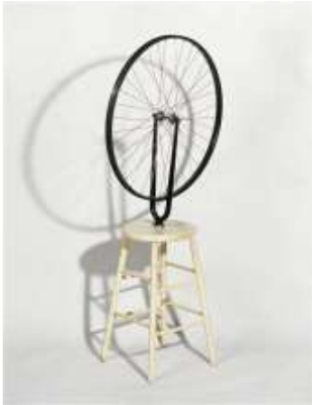
Roue de bicyclette, 1913