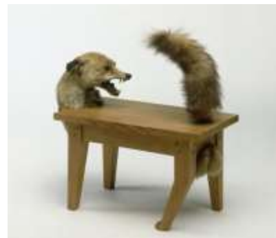
Loup-table, 1947 Victor Brauner