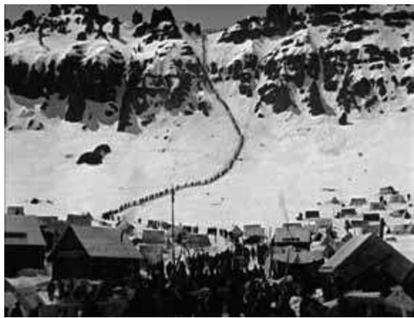
Photogramme du film : 1922