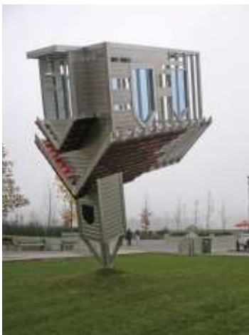
Device to root out of evil , 1938, Dennis Oppenheim, Vancouver – Canada