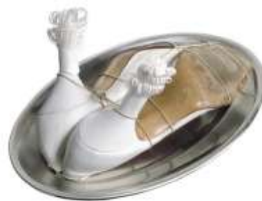
Ma gouvernante, 1936 Meret Oppenheim