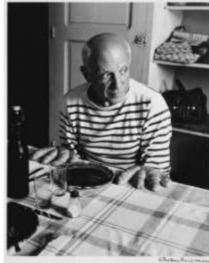
Les pains de Picasso , 1912 Robert Doisneau, MAMo Paris