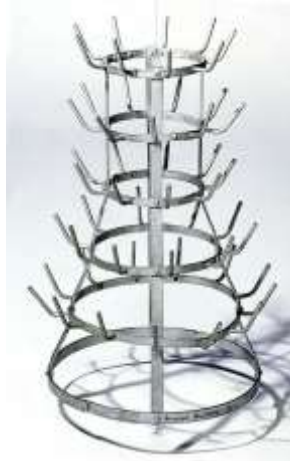
Ready-made « objet usuel promu à la dignité d'œuvre d'art par le simple choix de l'artiste », 1914