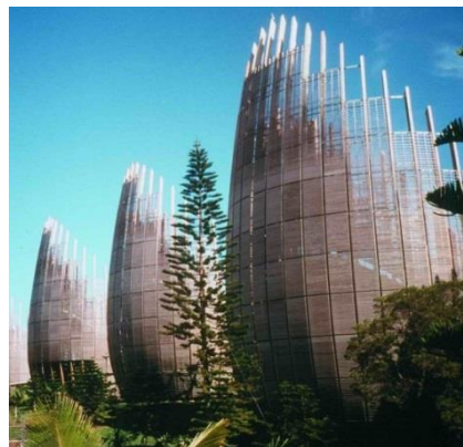
Renzo Piano, Centre culturel de Tjibaou, Nouvelle Zélande 2013