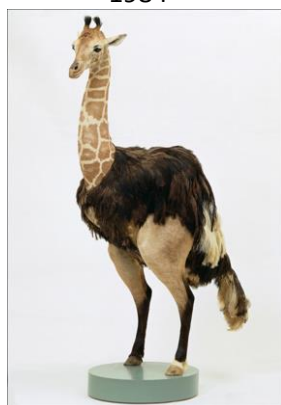
Thomas Grünfeld, Misfit (girafe, autruche, cheval) , 2000