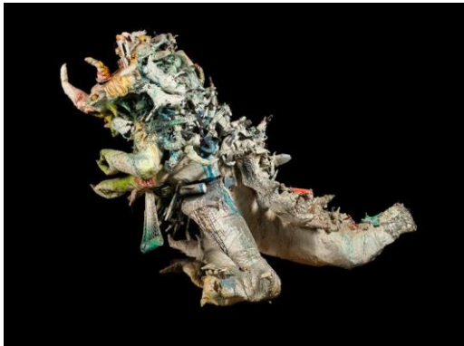
Niki de Saint Phalle, Le monstre de Soisy , 1966

https://cdn.reseau-canope.fr/archivage/valid/152665/152665-21618-27567.pdf