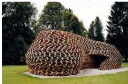
LOEBERMANN Matthias (architecte), Palettenpavillon , 2010