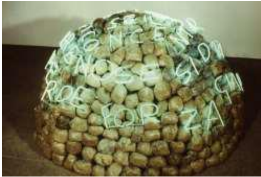
MERZ Mario (1925-2003), Igloo de Giap , 1968