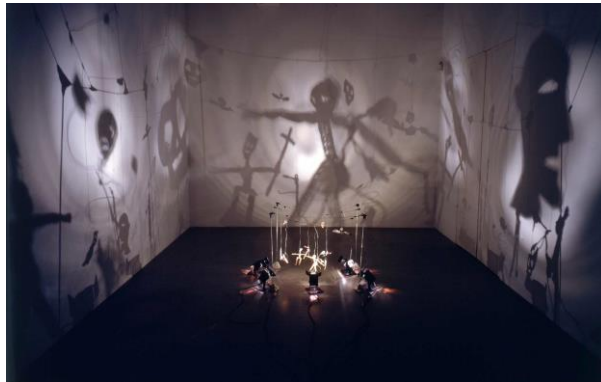
Christian BOLTANSKI, Danse macabre (Théâtre d'ombres) , 1984