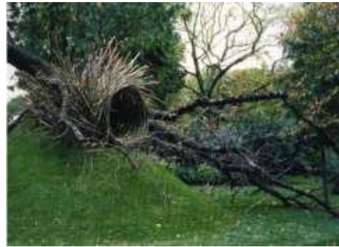
UDO Nils (né en 1937), Habitat , 2000, Paris Jardin des Champs-Élysées