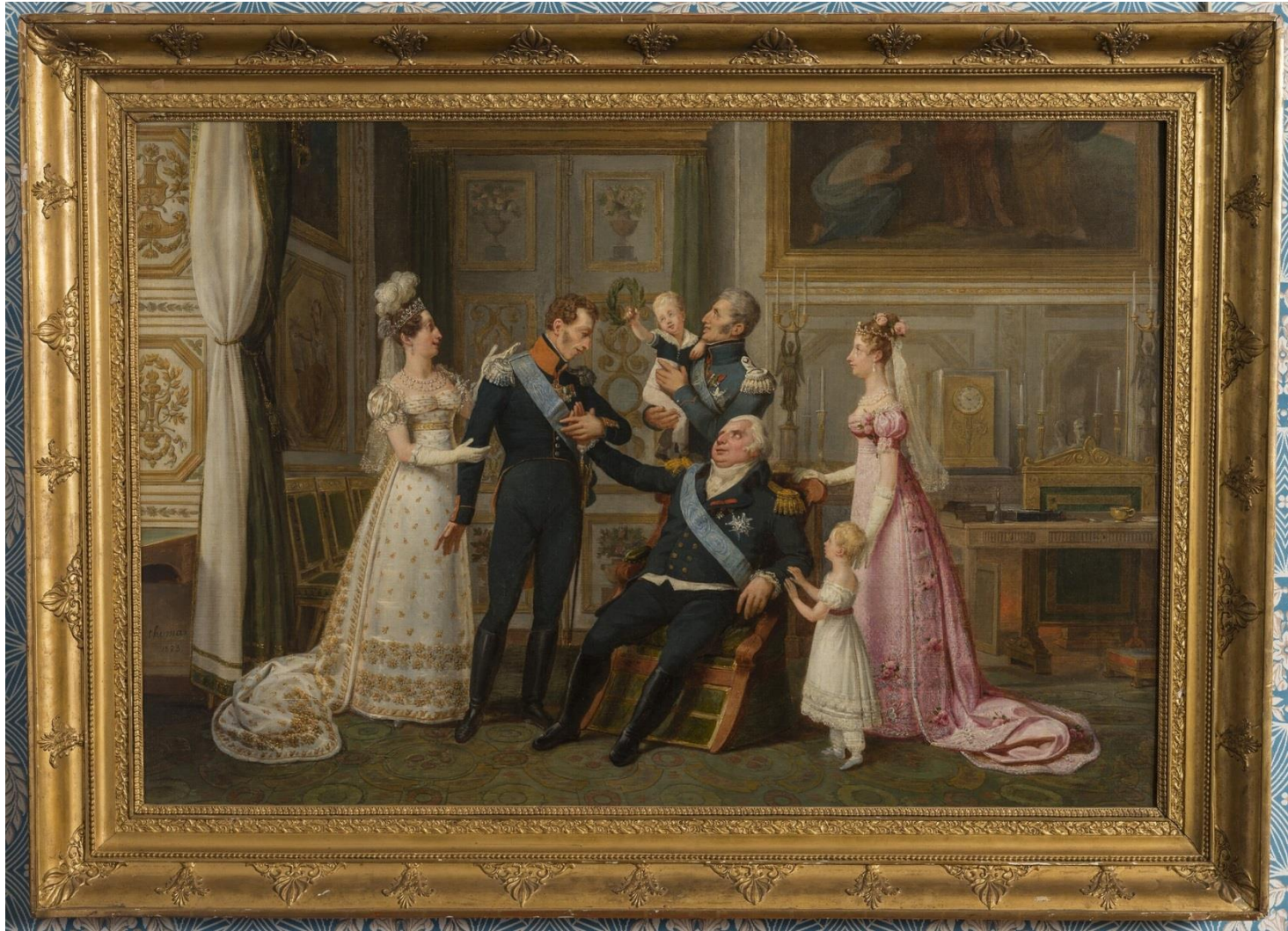
Antoine-Jean-Baptiste Thomas, 1823

Louis XVIII reçoit le duc d'Angoulême au retour de la guerre d'Espagne, 2 décembre 1823