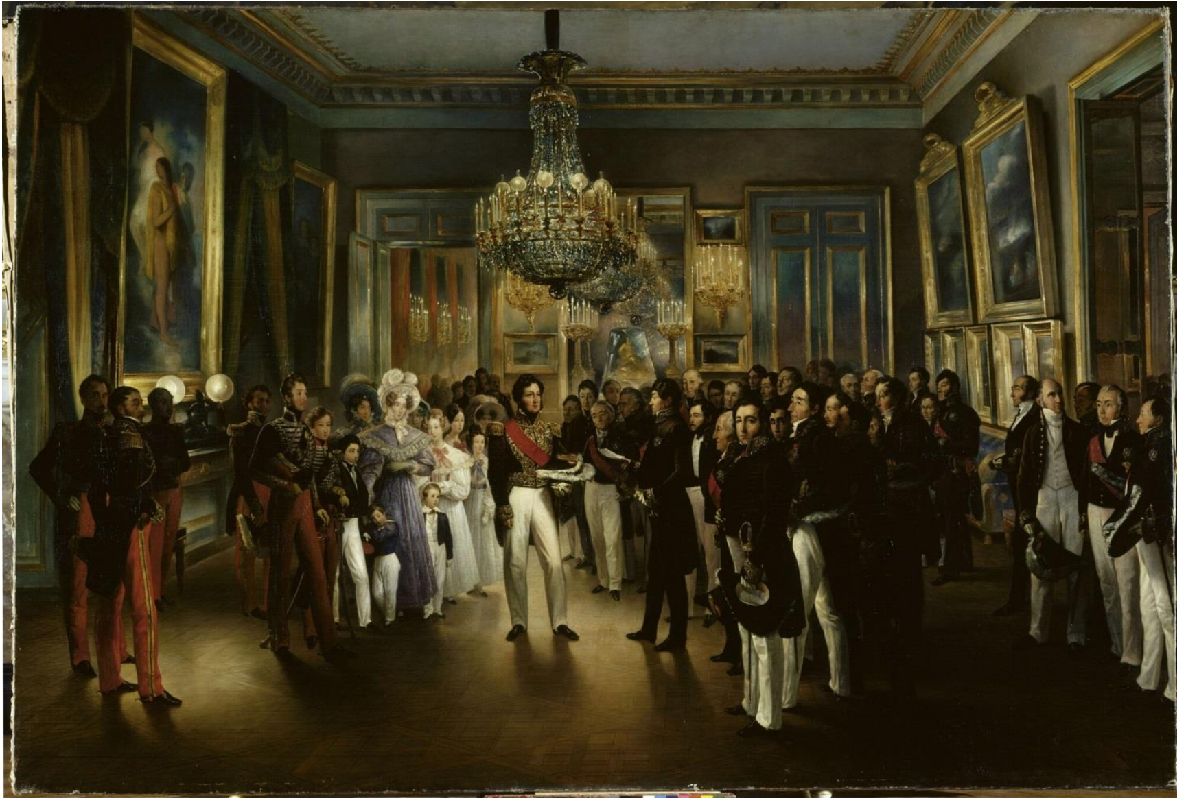
François-Joseph Heim, 1835

La Chambre des Pairs présente au duc d'Orléans l'acte qui l'appelle au trône, 7 août 1830