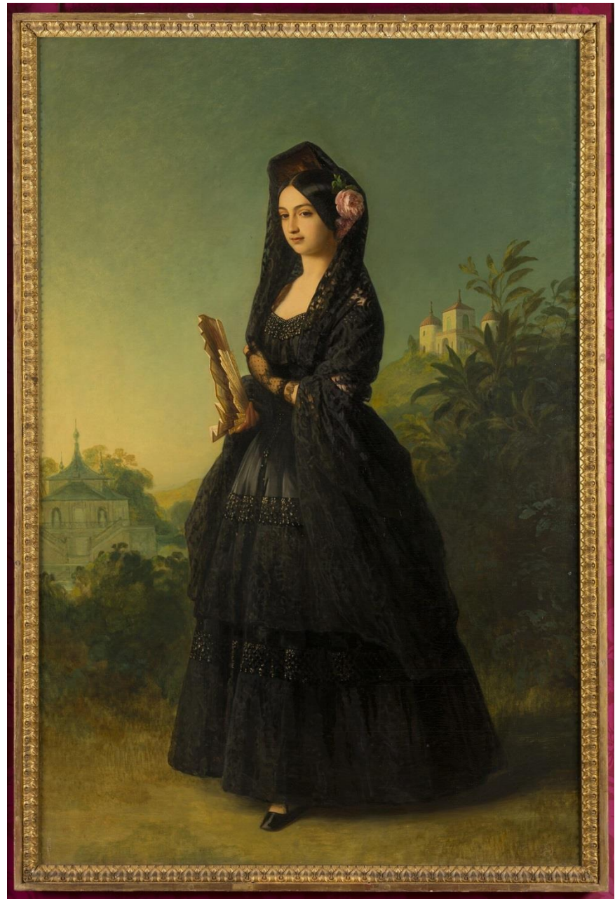
Franz-Xaver Winterhalter, 1801-1850