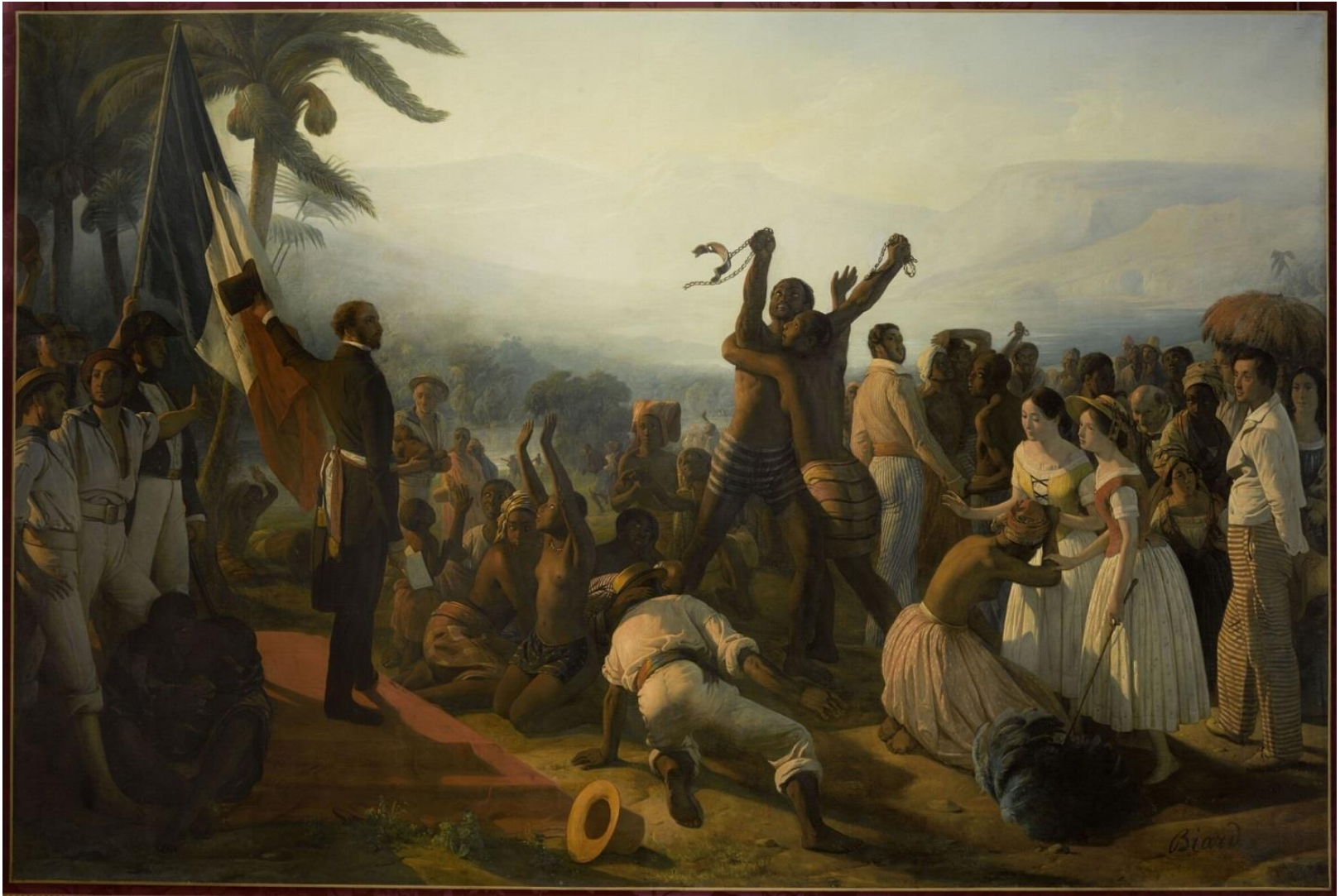
Jean-Auguste Biard, 1849