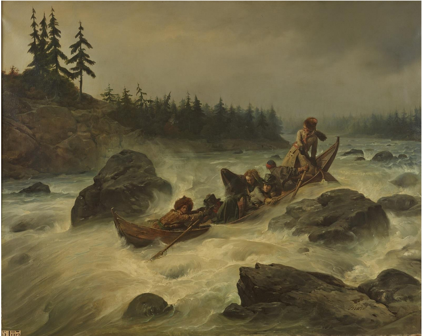
Jean-Auguste Biard, 1840