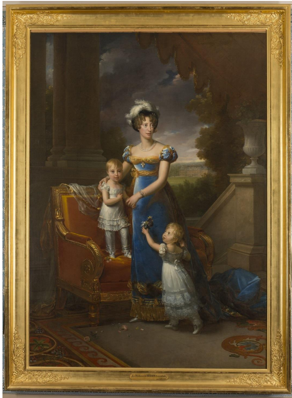
François Gérard, 1822