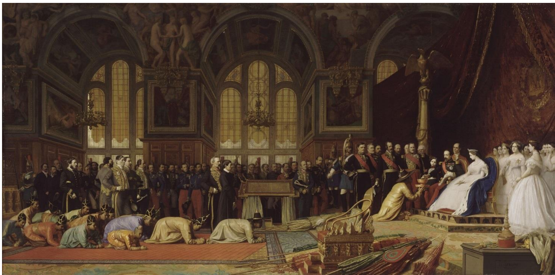
Jean-Léon Gérôme, 1864