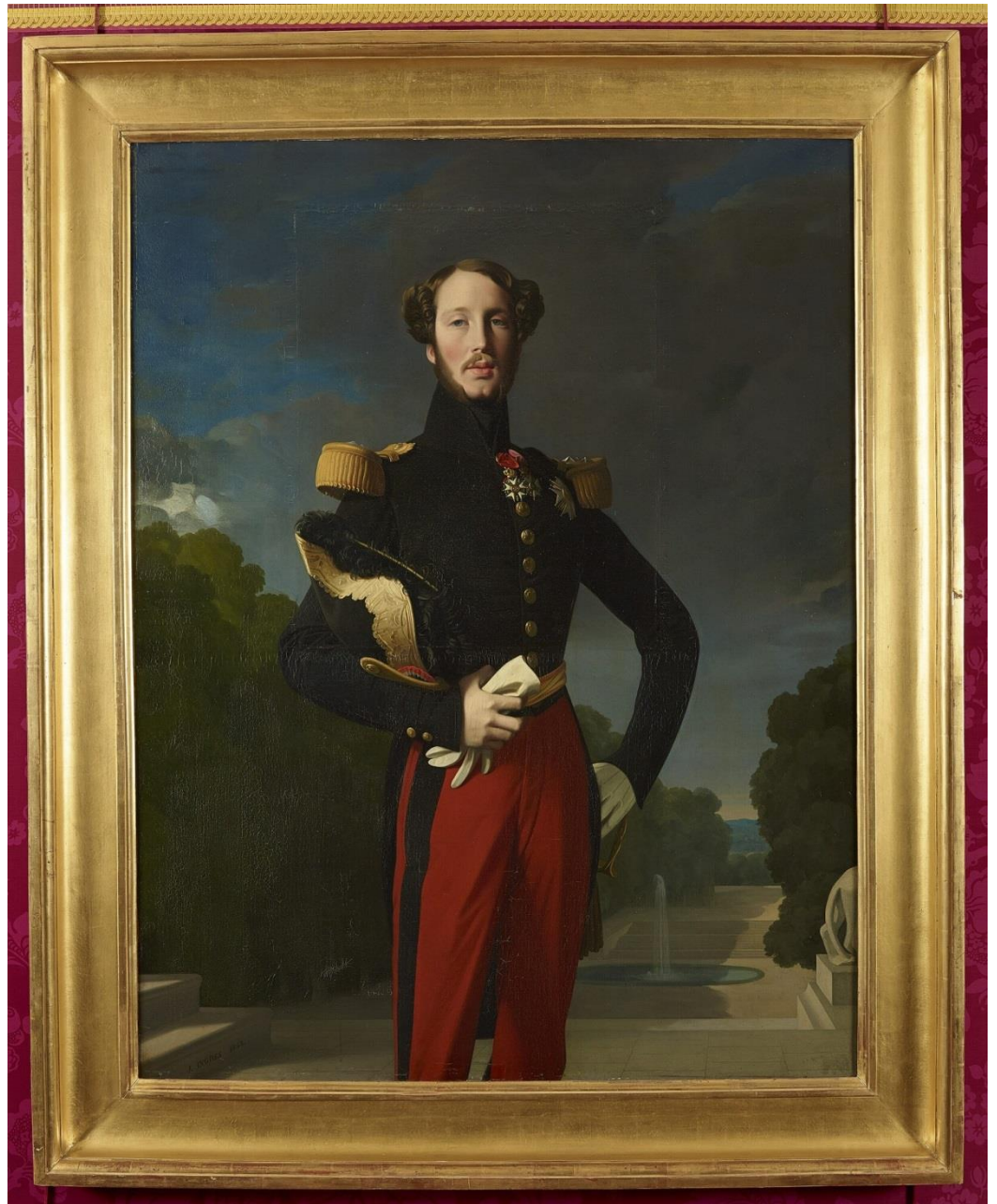
Jean-Auguste-Dominique Ingres, 1843