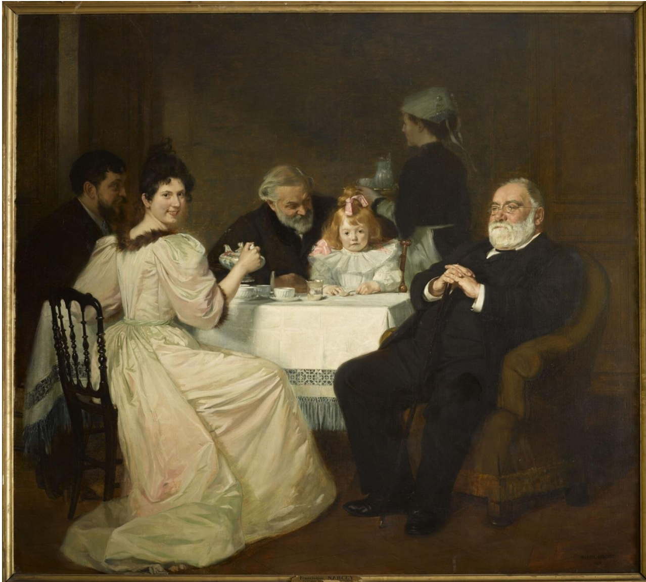
Marcel Baschet 1893