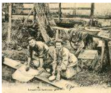
Lavandières à Bouloire