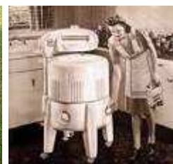
Machine à laver