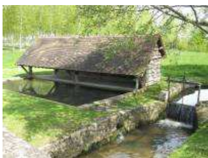
Ancien lavoir de Saint-Biez-en-Belin