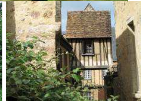
Bâtiments anciens sarthois

Lors de la visite, les élèves devront associer une maison avec un personnage : en observant les bâtiments, il leur faudra effectuer des choix justifiés et argumentés : tel personnage pourrait résider dans ce type de bâtisse parce que.... Cette approche obligera les élèves à observer avec attention et surtout à qualifier le bâtiment observé.