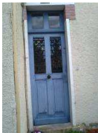
porte du début du XXème