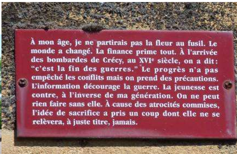
Monument vivant de Biron, Jochen Gerz, 1996