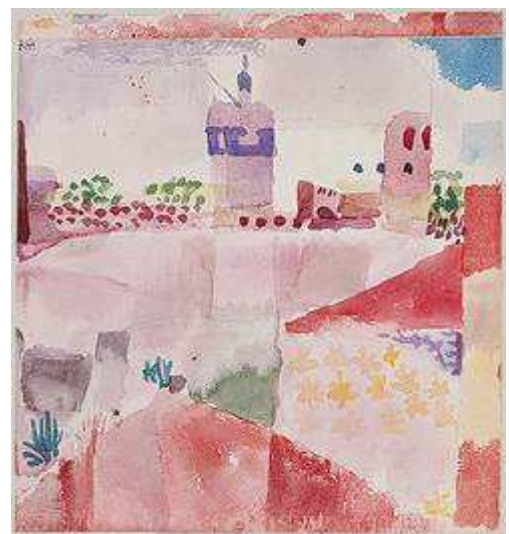
et de Paul Klee.