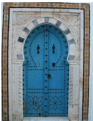
porte de style mauresque