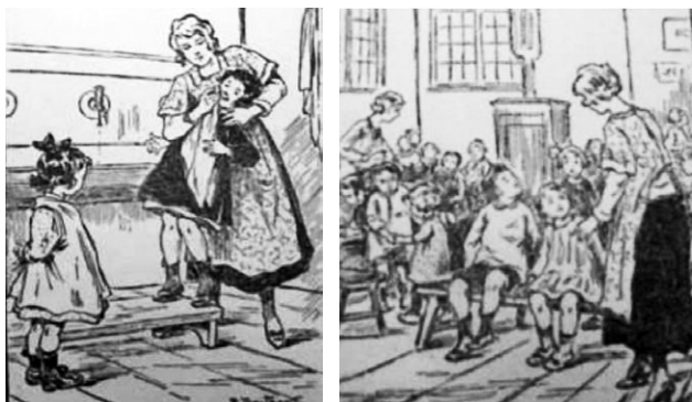
Des évolutions historiques communes