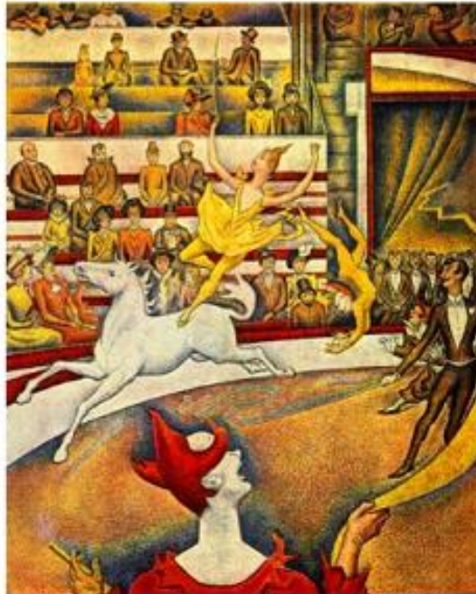
Le cirque , Georges Seurat (1890)

L'exercice équestre était le noyau du spectacle. Il est le cœur de l'œuvre de Seurat. Au premier plan, de dos, se tient un clown à la tête rouge, directement inspiré des affiches de l'époque.