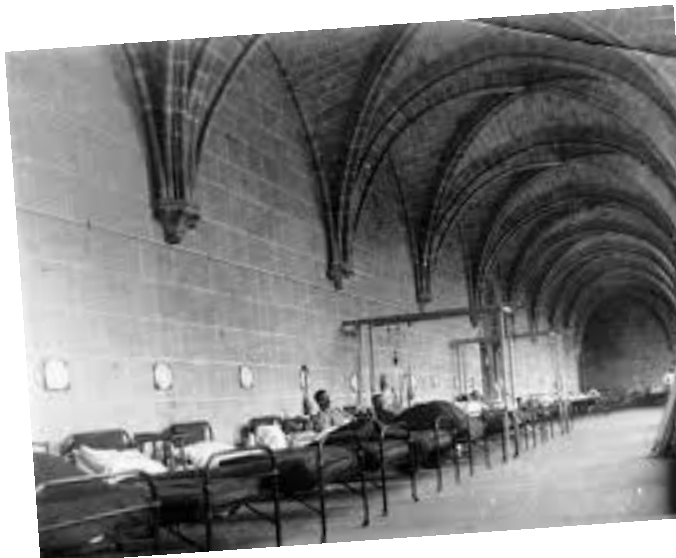
Archives Bibliothèque Henry et Isabel Göüin, Royaumont