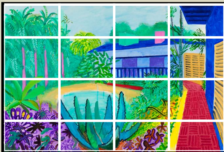
Garden, 2015, Acrylique sur toile, 122 x 183 cm David Hockney