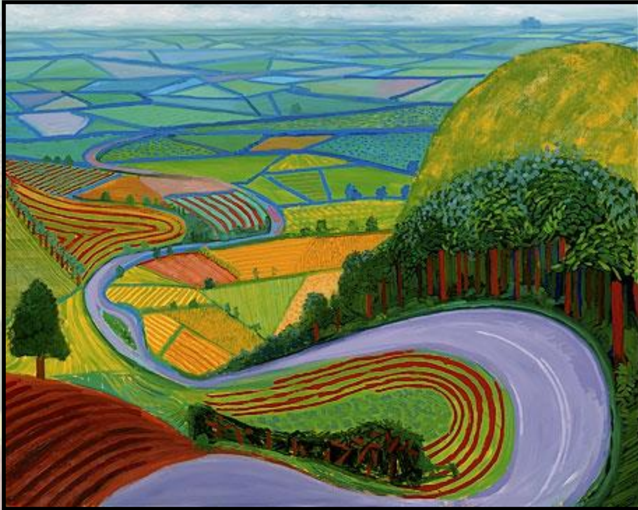
David Hockney, Garrowby Hill, 1998 Huile sur toile, 152 x 193 cm