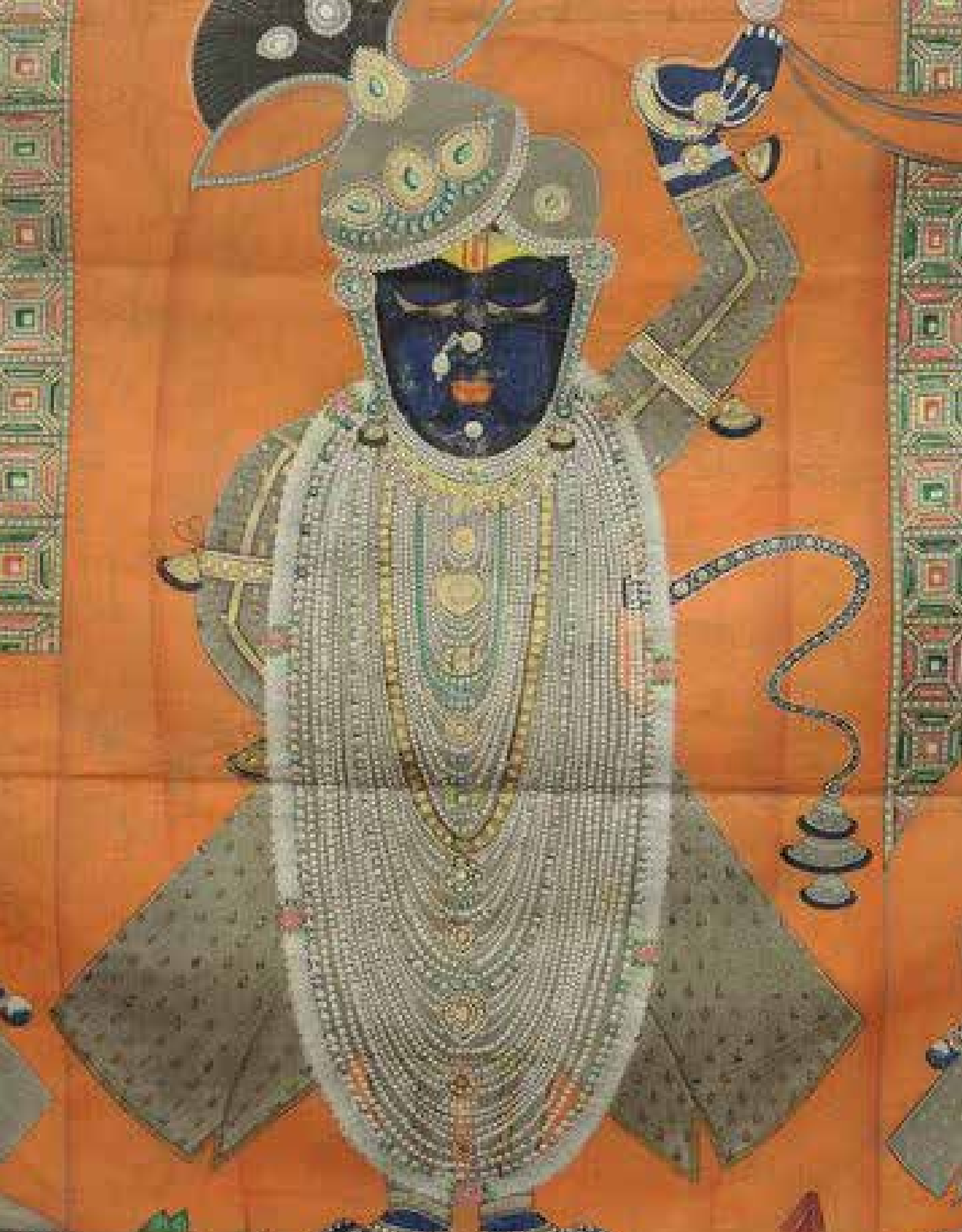
Détail de la tenture de temple : Krishna Shri Nathji et l'offrande d'Annakuta