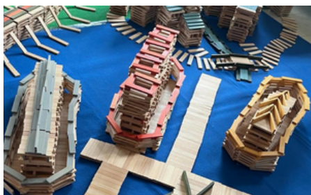
bateaux sur la Seine

Et bien les élèves ont réalisé différents symboles des JO de Paris 2024 ! Saurez-vous deviner lesquels ?