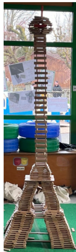
la Tour Eiffel